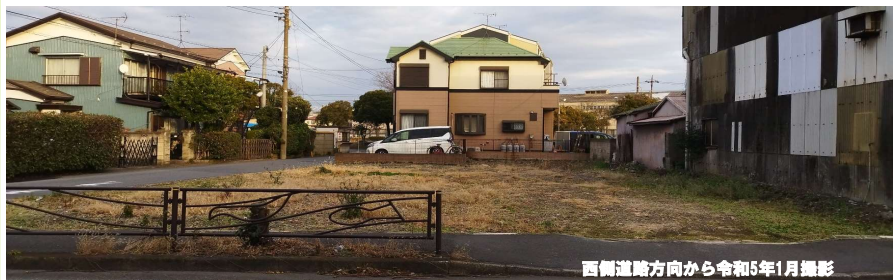
西側道路方向から令和5年1月撮影