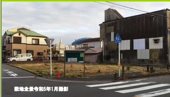
敷地全景令和5年1月撮影